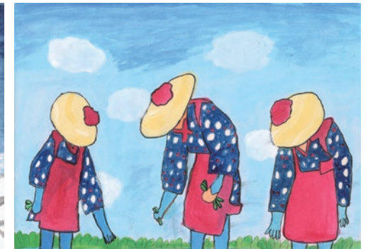
第6回 絵画コンクール優秀賞受賞作品